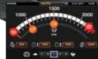
Die Einstellungen sind logisch und einfach einzurichten. Alle Einstellungen werden automatisch gespeichert.