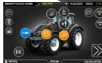
Einfache Navigation und Menüführung.