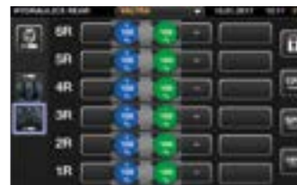
Sie können einer beliebigen Steuerung eine beliebige Hydraulikfunktion zuweisen, für alle Ventile, Hubwerke und den Frontlader.