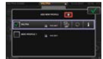
Profile für Bediener und Arbeitsgeräte, die leicht geändert werden können. Alle Änderungen werden automatisch im ausgewählten Profil gespeichert.