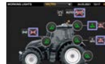
Sie können die Arbeitsscheinwerfer über den 9-Zoll-Touchscreen einstellen. Premium und Premium+ enthalten ein einstellbares Abbiegelicht mit Steuerung über den Radwinkelsensor.