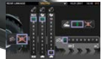
Der 9-Zoll-Touchscreen sowie die Bedienelemente, Einstellungen und Funktionen sind leicht zu verstehen.